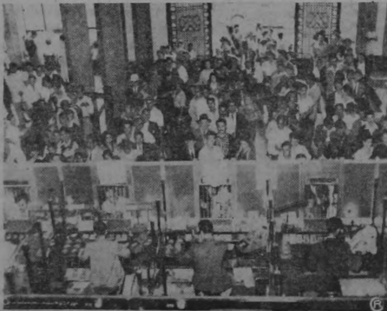
El Banco Central, Cajero del Estado, prestó servicios de gran eficiencia en el cambio de los giros.