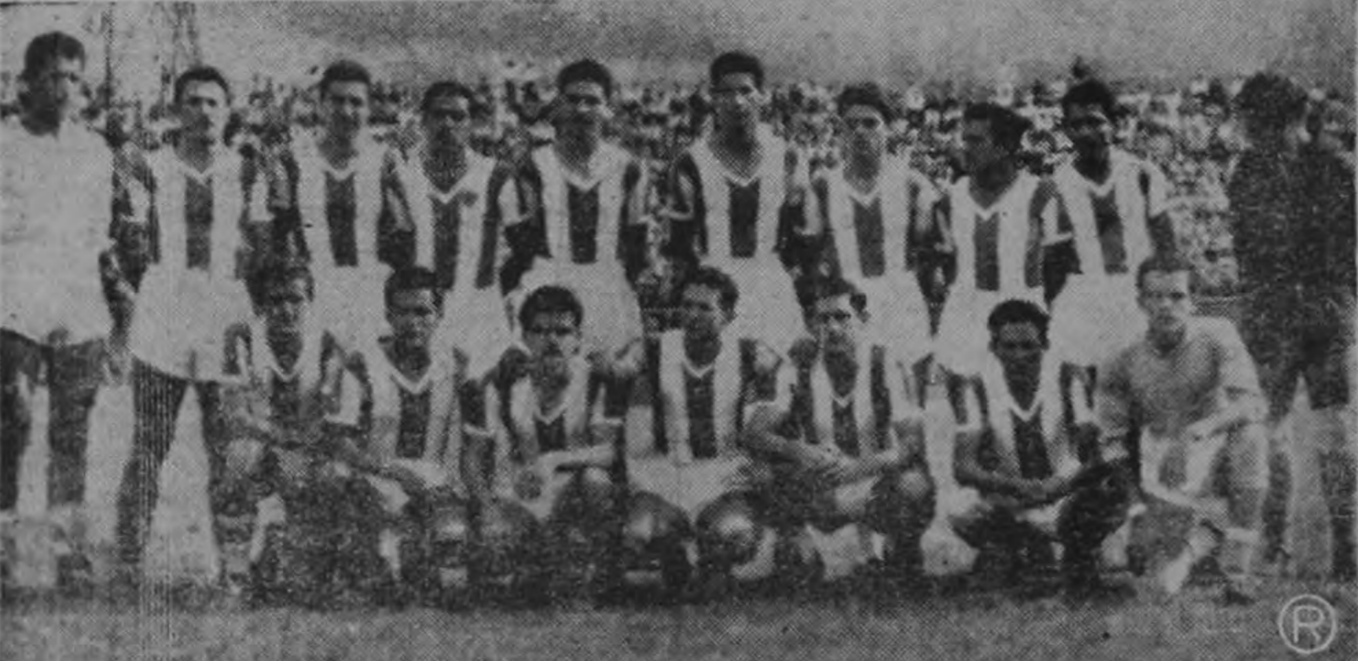
Los blanquirojos engolosinados con su primer triunfo de campeonato logrado el domingo pasado frente a los crionistas, trataran de anotarse otro éxito esta noche frente a los verdiblancos. Será una gran oportunidad para los gimnásticos para consolidarse en el tablero de posiciones pero para ello tendrán que jugar mucho.

El equipo de Loyola competará en San Salvador contra selecciones de la República Dominicana, Cuba y El Salvador.