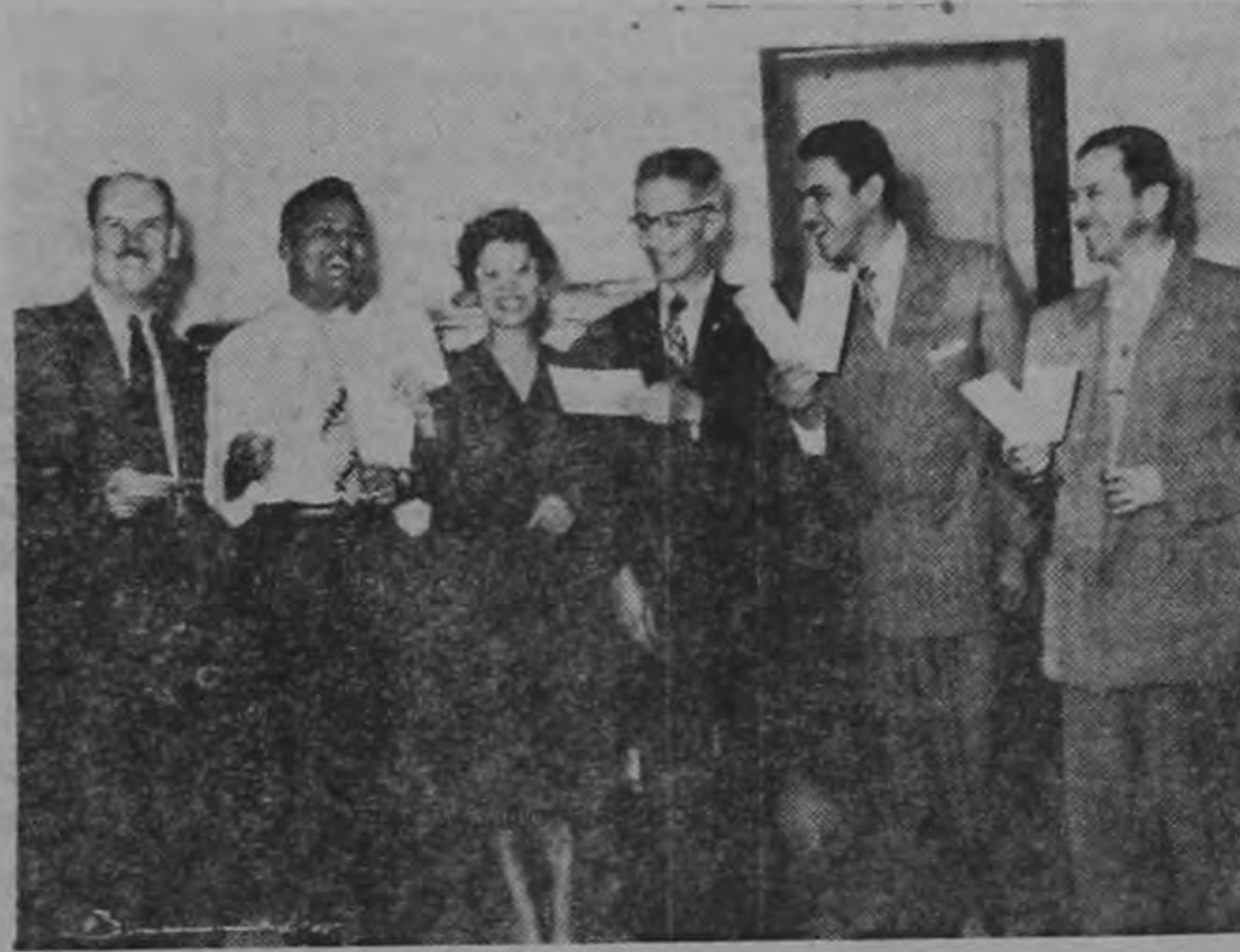
Personal de la Contraloría celebra el recibo del giro adicional de fin de año.