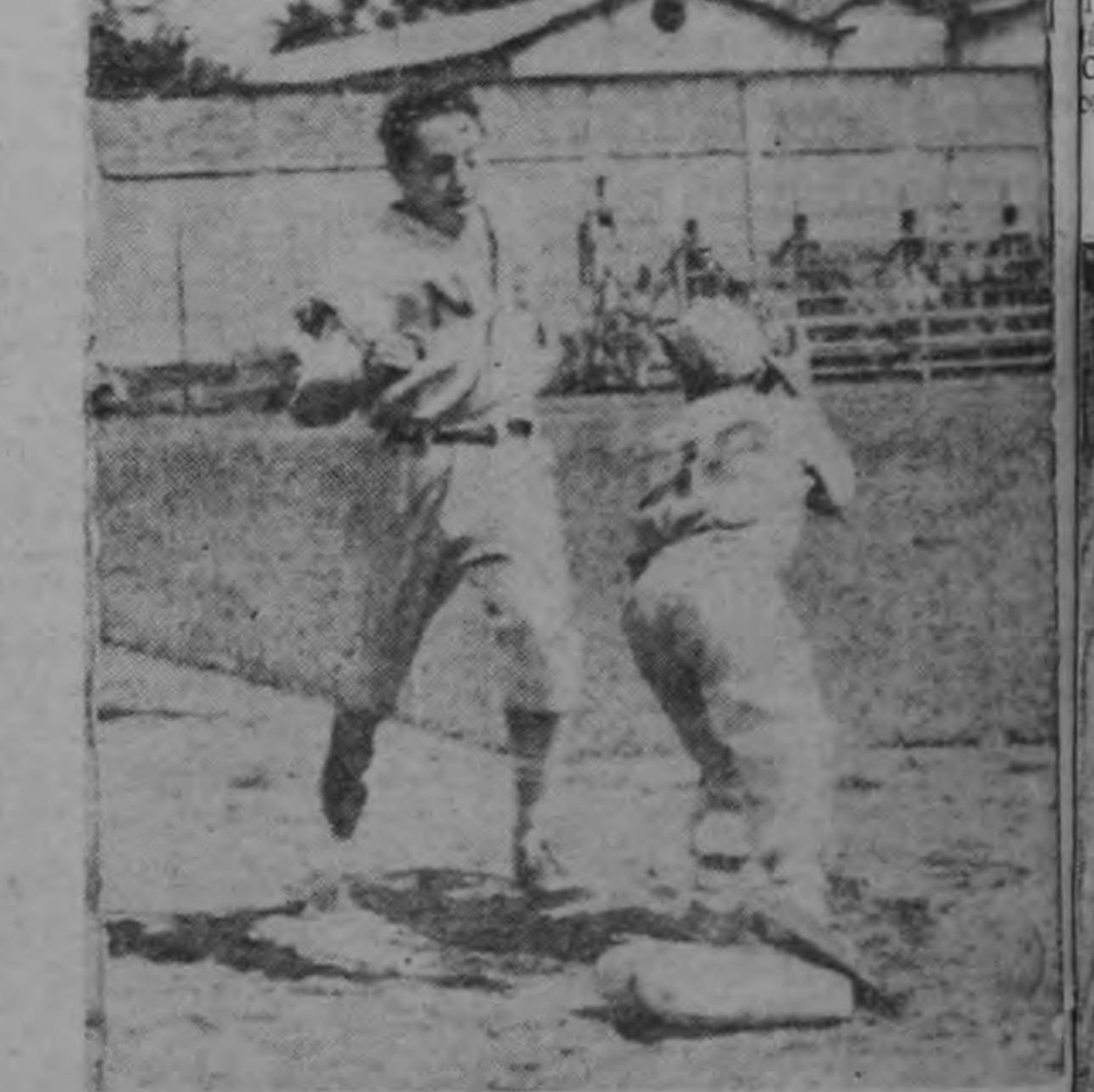
LO ENFRIARON EN LA PRIMERA ALMOHADILLA. — Esta gráfica corresponde al partido celebrado en el Parque Antonio Escobar entre NUEVE ESTRELLAS colista de primeras y CINCO ESTRELLAS Comisión de Segundas. El corredor del Nueve Estrellas corrió mucho tratando de llegar salvo a la primera base, pero lo enfriaron con un tiro perfecto de short a inicialista.