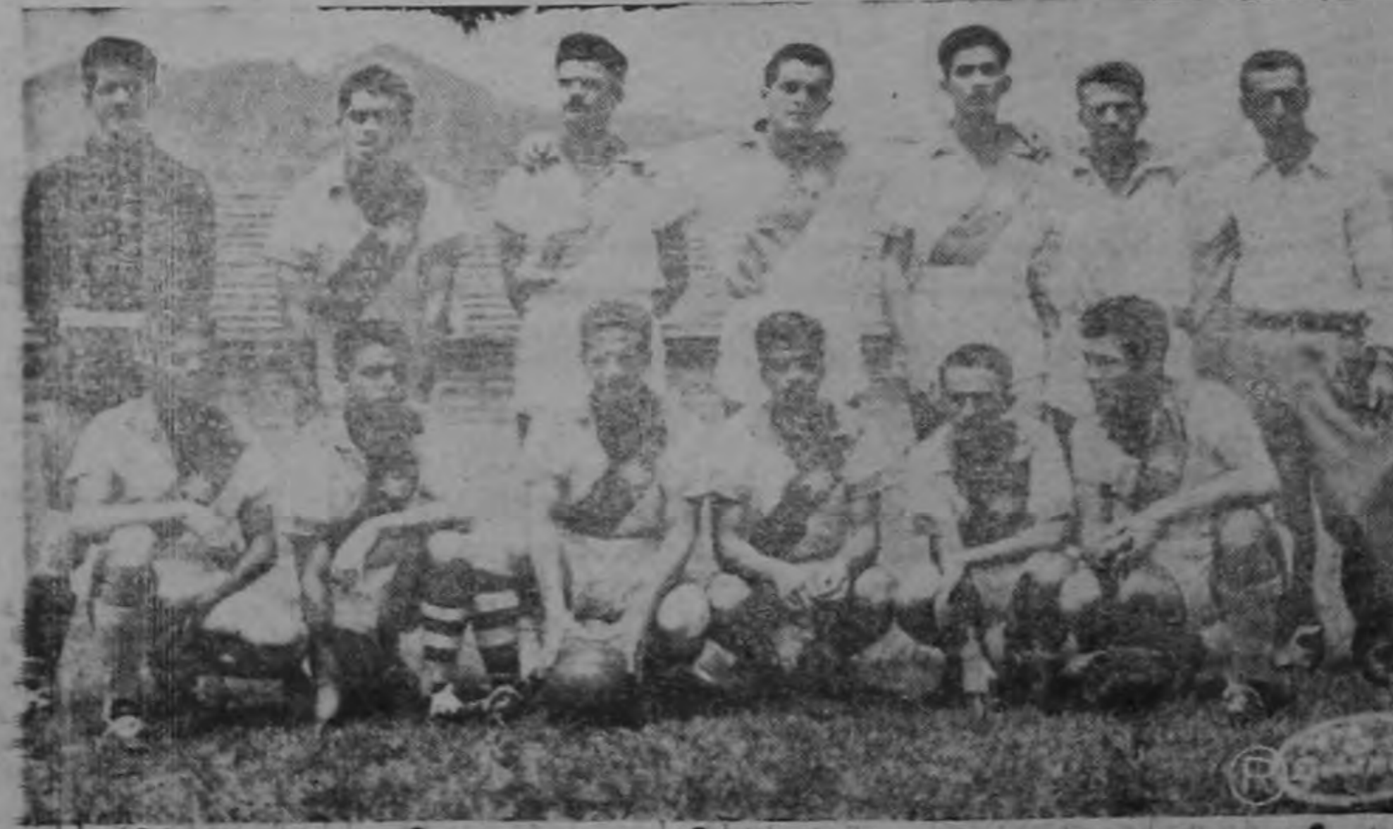
Los reclutas tendrán que luchar muy a fondo esta noche para superar a un equipo rojo crecido después de su reciente triunfo. Los moravianos cuentan con un equipo rápido y aguerrido en donde faltan delanteros efectivos pues solo han marcado dos goles en lo que va del campeonato.