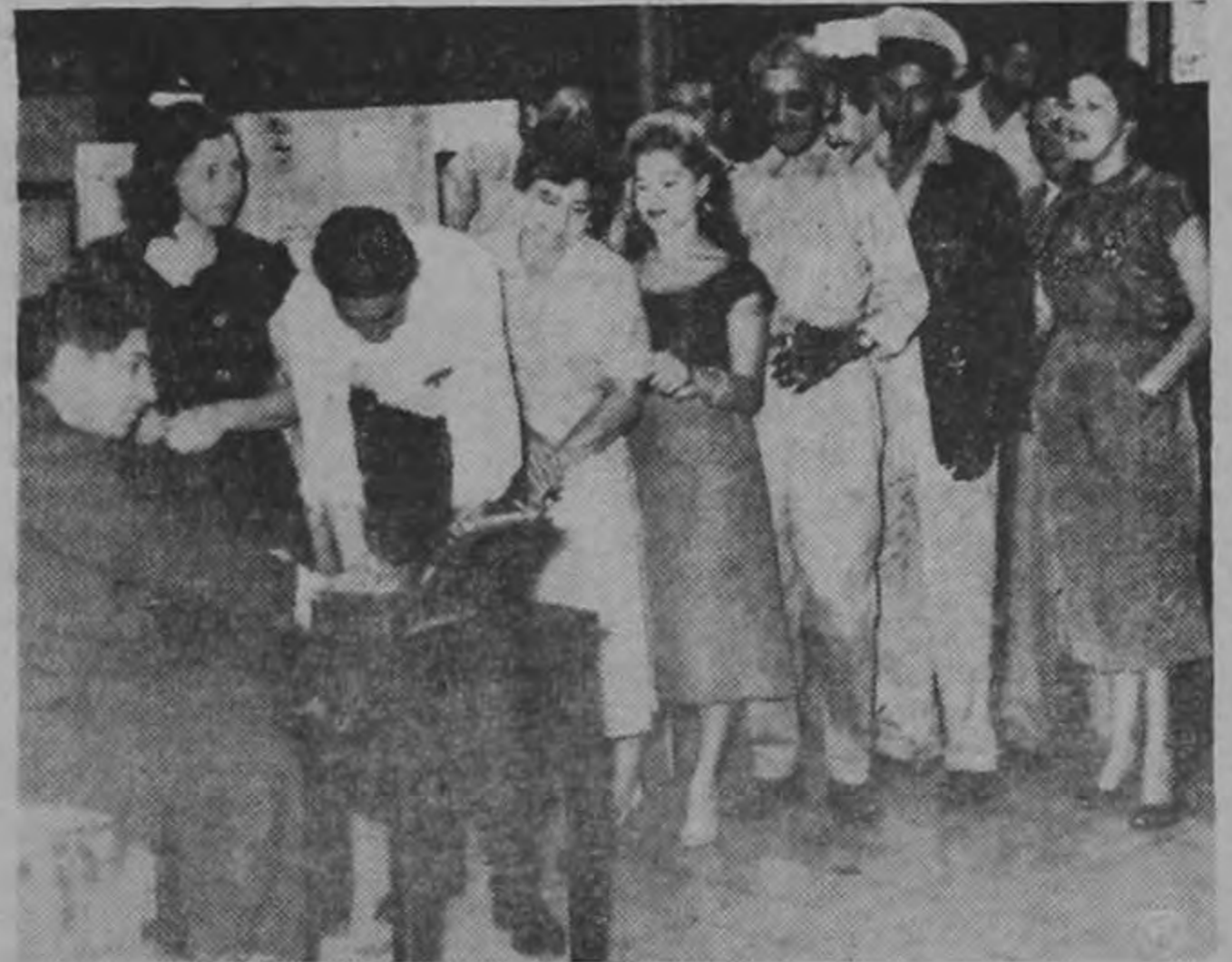
Simultáneamente todos los Pagadores Nacionales se movilizaron para hacer entrega de los giros por ₡ 10.033.850