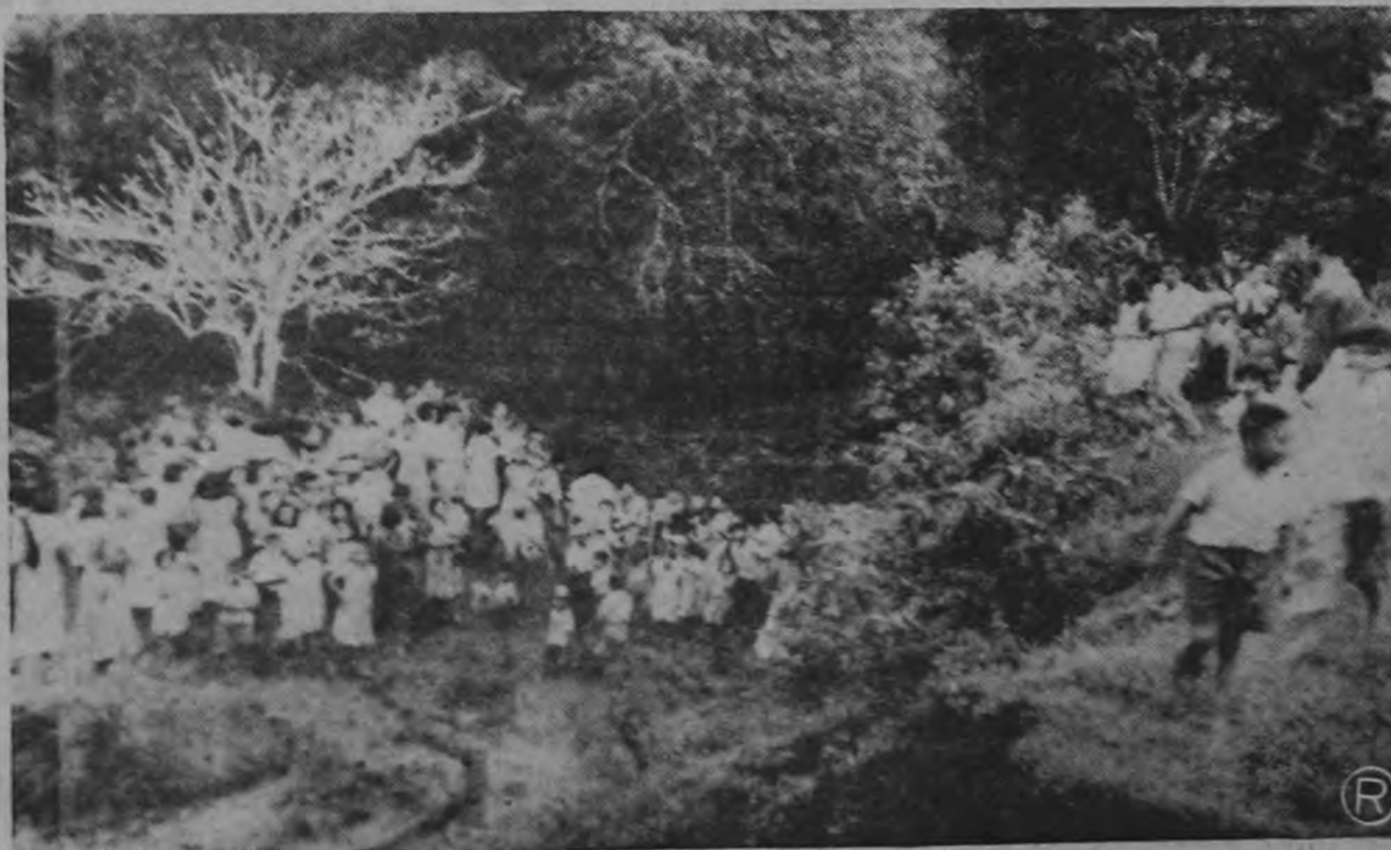
La gráfica recoge el lugar exacto en donde ocurrió la lamentable tragedia producida por una demente.