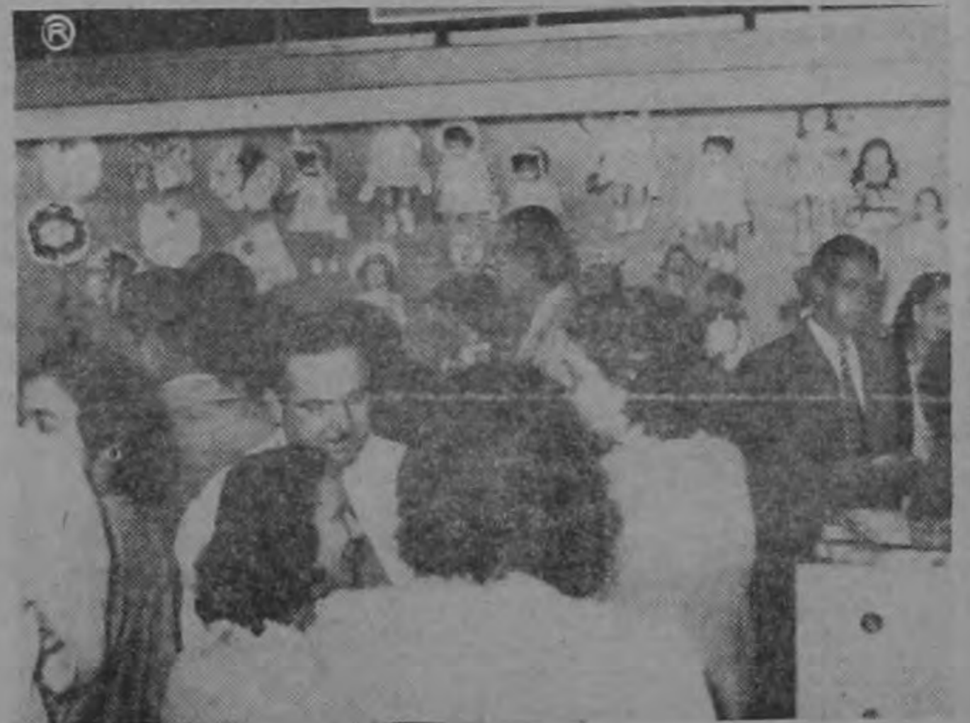
Gran movimiento comercial con motivo del pago del aguinaldo de fin de año a los Empleados Públicos.

Estos pagos se han hecho mediante la gran eficiencia y la coordinación demostrada por la Tesorería Nacional, Oficina Técnica Mecanizada, Pagaduría de Hacienda y Banco Central. Además, todas las Oficinas Presupuestales del Gobierno colaboraron para este servicio en la revisión de las planillas.